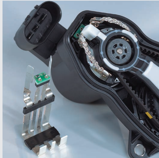
OECHSLER-Baugruppe: Aktuator für elektrische Parkbremse

Wir beschriften u. a. mit Datamatrix, Barcode oder Klartext – wahlweise mit Laser- oder Tintenstrahldruck und/oder mit selbstklebenden Etiketten. Integrierte Kamerasysteme prüfen und dokumentieren dabei die korrekten Abläufe. Bei Bedarf verpacken wir die montierten Baugruppen vollautomatisch und liefern sie z. B. in dichter, nicht ausgasender Verpackung, ggf. auch in Reinraumqualität.