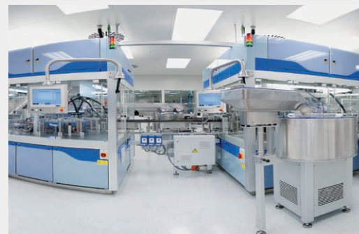
Montage im Reinraum

verfolgung) ist selbstverständlich. Eine Erfolgsgeschichte ist das Inhalationsgerät